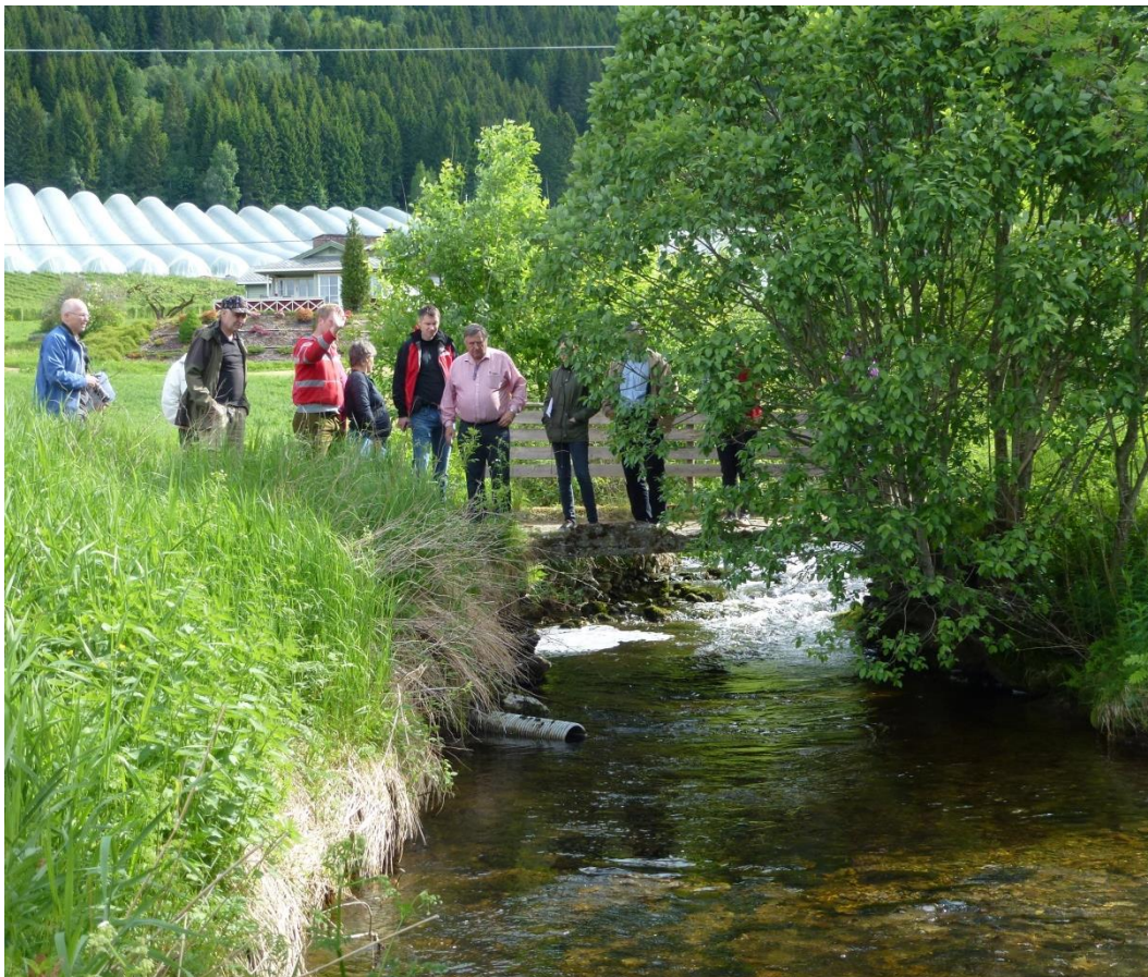
Nordfjord vassområdeutval, lokal referansegruppe og interesserte, på synfaring i Hildeelva 6. juni 2013.

Fleire av direktorata har tilskotsordningar som kan være aktuelle for å søke finansiering av overvaking og tiltaksgjennomføring m.m. Desse ordningane vil kunne bli endra frå år til år og det er difor ikkje føremålstenleg å gje ei samla oversikt då den fort blir utdatert.