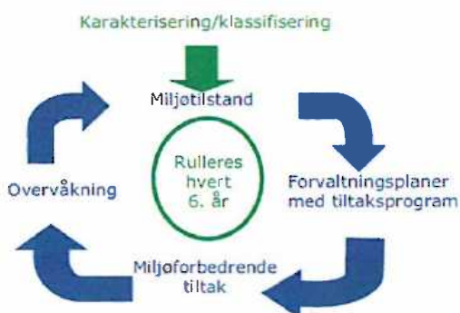
Figur 2. Planhjulet for gjennomføring etter vannforskriften.