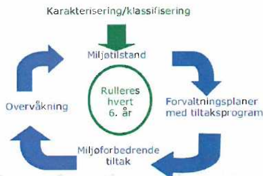
Figur 2. Planhjulet for gjennomføring etter vannforskriften.