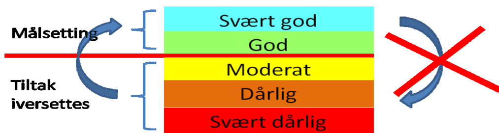
Figur 2: Kjemisk- og økologisk tilstand vert klassifisering på ein skala frå særst dårleg til særst god. Tiltak må setjast i verk i vassførekomstar der tilstanden er moderat eller dårlegare for å nå miljømåla om god eller særst god tilstand. Vassførekomstane skal ikkje forringast frå særst god/god til ein dårlegare tilstandsklasse.