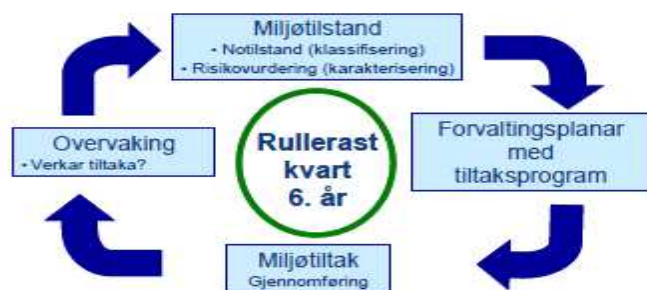
Fig. 4 -Arbeidet med vassforskrifta vil vere kontinuerleg og skal rullerast kvart 6. år.

Planprogrammet til forvaltningsplan for vassregion Sogn og Fjordane viser arbeidet med vassforskrifta slik: