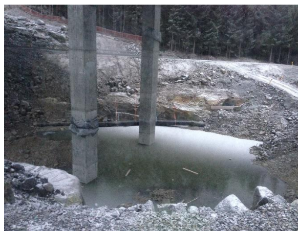
Brokar og trenering