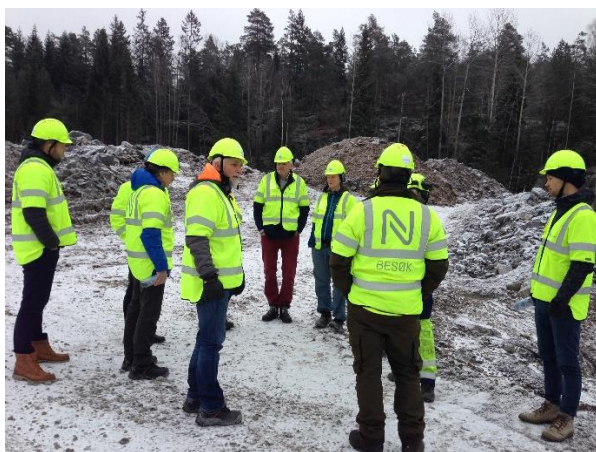
Vei under bygging