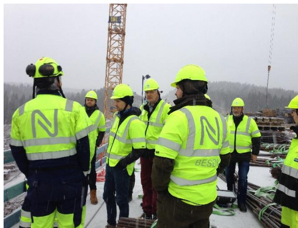
På Stemmen bro