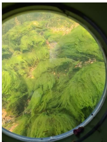
Figur 4. Algevekst fotografert gjennom vasskikket.

Algefloraen på alle dei 7 stasjonane var dominert av trådforma grønalgar av slektene Oedogonium , Microscopora , Zygnema , Bulbochaetae og Mougeotia . Ingen av desse algane blir rekna som indikatorar på dårleg vasskvalitet. Men det er ikkje uvanleg at enkelte av artane av og til kan opptre i store mengder og gje problem for mellom anna garnfiske. Det blei ikkje observert heterotrof begroing.